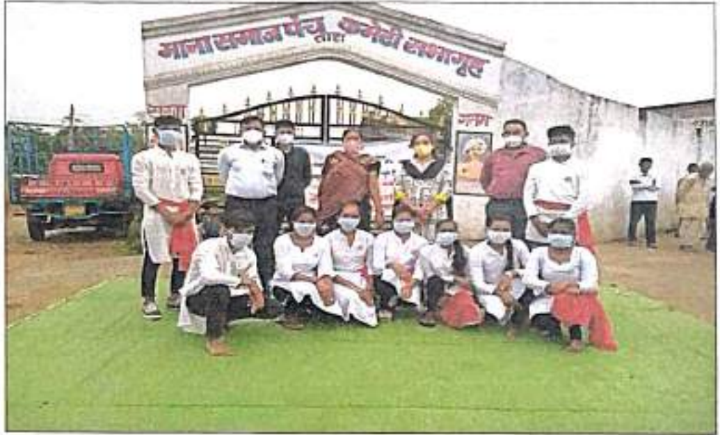
The Volunteers of N.S.S Unit of Bhiwapur Mahavidyalaya, Bhiwapur performing Street Play