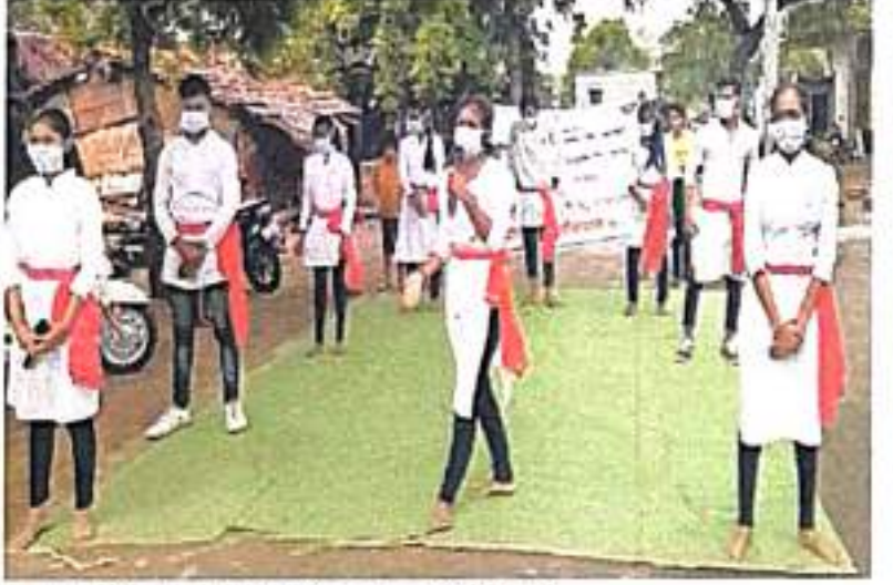
मरठापार पारधी बेड्यात पथनाट्याचे सादरीकरण करताना तसेथेचे विद्यार्थी.

लोकमत न्यून नेटवर्क बिवापुर: पारधी बेड्यात लसीकरणाचे प्रमाण एका हाताच्या बोटांवर मोजण्याइतकत आहे. त्यामुळे तेथे लसीकरणाला जागर महत्त्वाचा आहे. सरसंध्यांनी ही लोकोद्दिष्टादी भूमिका 'त्या' पथकात पारधी बेड्यात घेऊन गेली. पथनाट्य सुरू झाले अन् लागतील आरडाओरड सुरू झाली. विद्यार्थी घाबरले. मात्र सरसंध्यांनी विधास दाखवित, पथनाट्य सुरू ठेवण्यास सांगितले. नंतर पारधी बेड्यातून त्याला प्रतिसादही मिळाला. मात्र 'जान्ही लस घेणार नाही' हा त्यांचा सूर कायम होता.