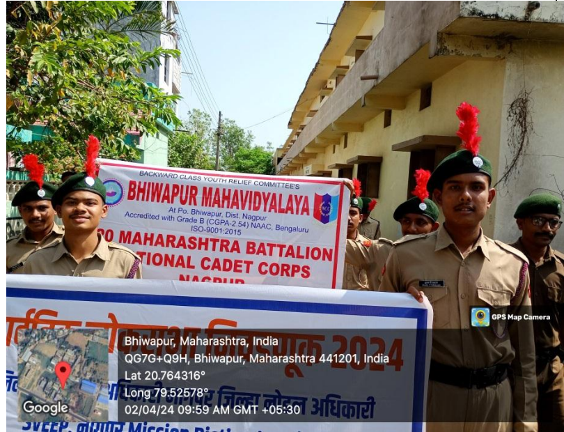
NCC Cadets during the Rally