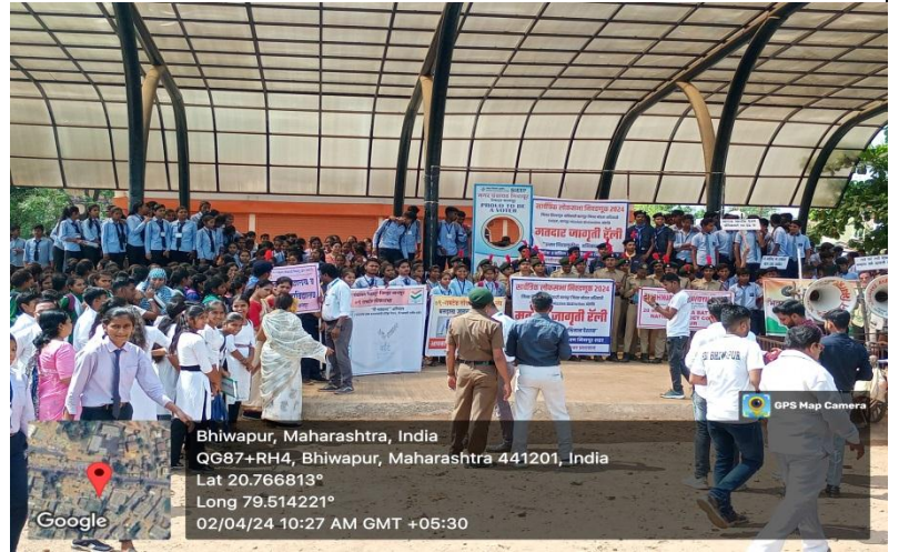
A glimpse before concluding the Rally