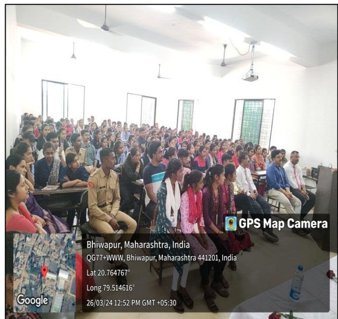
Participants enjoying the Inaugural Session of the Workshop