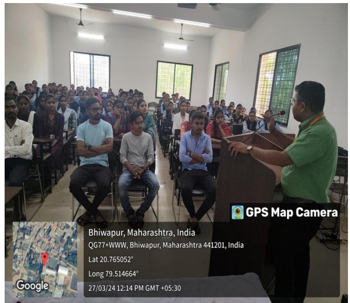
Mr. Uprikar conducting the Session on the Second Day of the Workshop