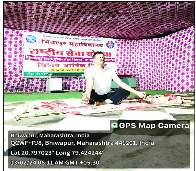
Volunteers of N.S.S. performing Yoga during the Camp