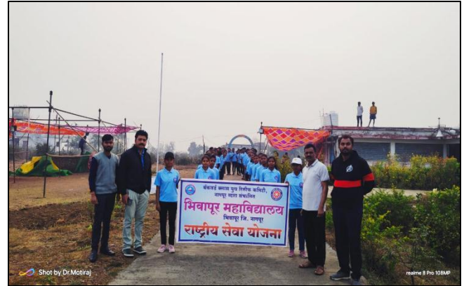
Volunteers of N.S.S.in action, during the ‘Shramdaan’