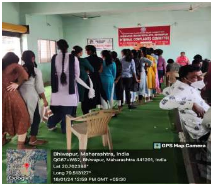
Distribution of Medicines during the free Health Check-up Camp.