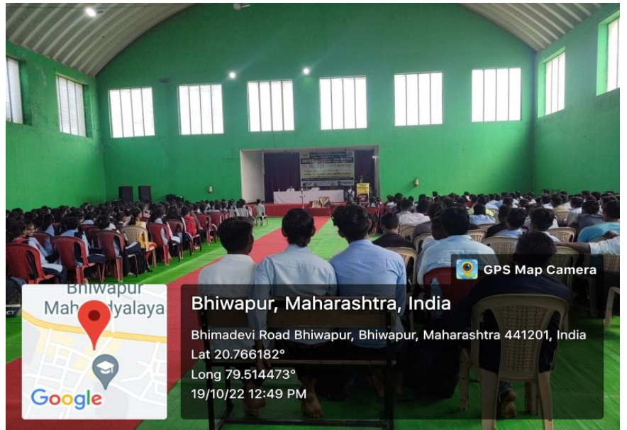
Students engrossed in the Workshop