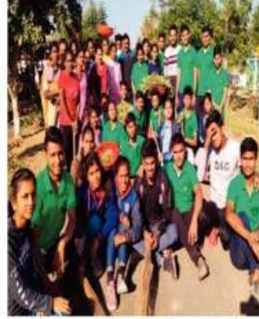
गोसेखुर्द प्रकल्पबाधित सालेतहरी-सातेभट्टी पुनर्वसित गावात निवासी शिबिरात श्रमदान करणारे रासेयोचे विद्यार्थी.

भिवापूर महाविद्यालयाच्या राष्ट्रीय सेवा योजनेच्या वतीने तालुक्यातील सातेरहरी-सातेभट्टी या गोसेखुर्द पुनर्वसित गावात 'दुवकांचा ध्यात ग्राम-शहर विकास' या संकल्पनेवर आधारित सात दिवसीय निवासी