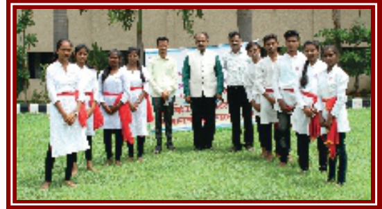
महाविद्यालयाचे रासेयो पथनाट्य संघ