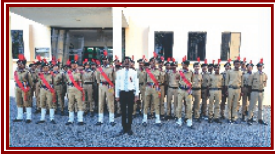
महाविद्यालयाचे एनसीसी युनिट