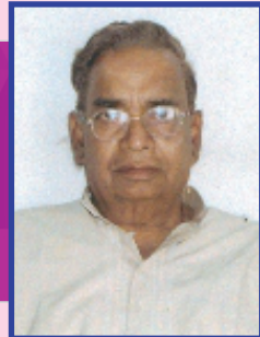
श्री पद्माकरजी अग्रवाल महाविद्यालय विकास समिती सदस्य