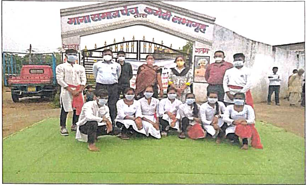
The Volunteers of N.S.S Unit of Bhiwapur Mahavidyalaay, Bhiwapur performing Street Play