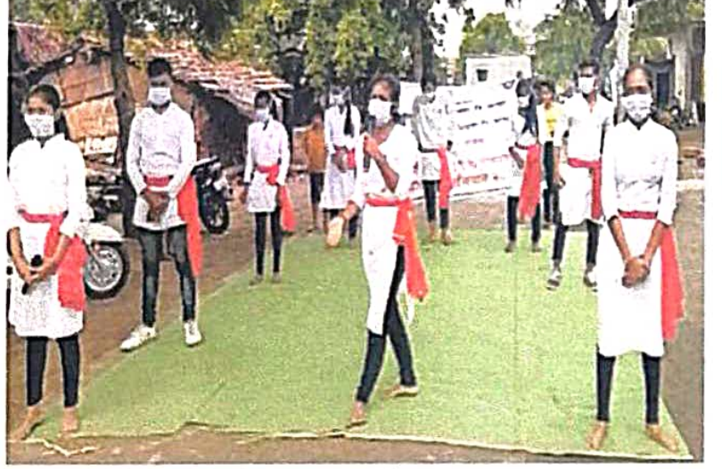
गरडापार पारधी बेड्यात पथनाट्याचे सादरीकरण करताना रसेवोचे विद्यार्थी.