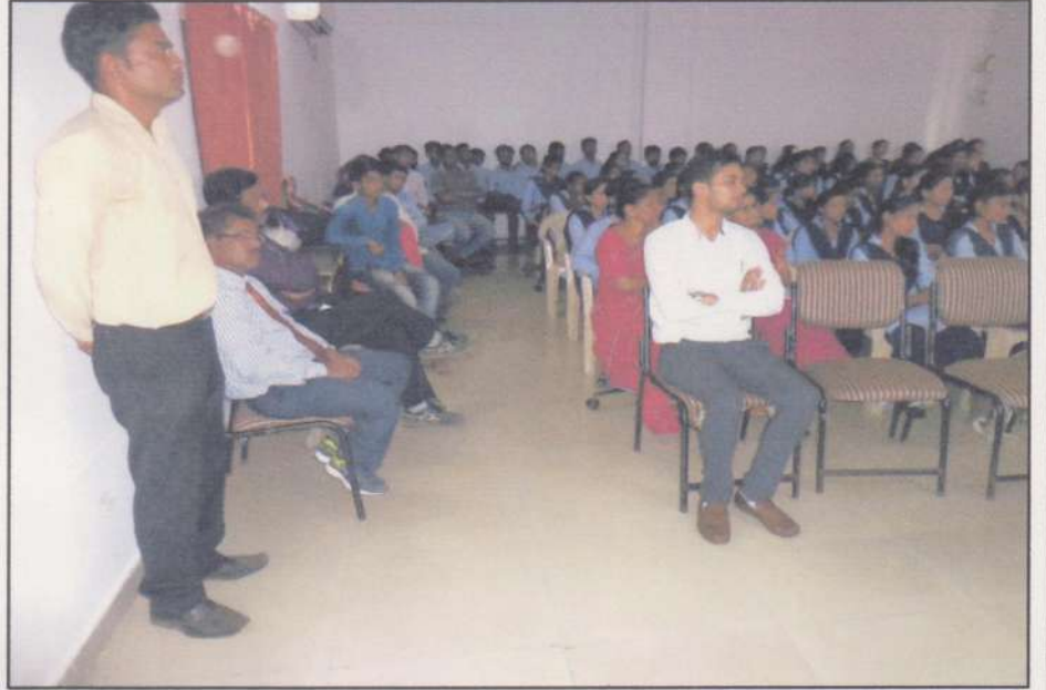
Students of Department of History during the Inaugural Ceremony