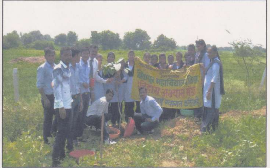
Students of History Subject Literary Association planting saplings in the College Campus on 5 th September, 2017