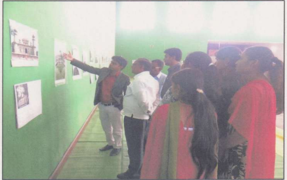
students of Arts and Commerce College, Bhis. District Chandrapur