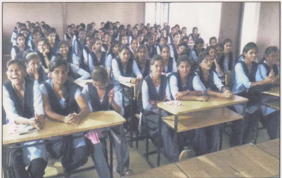
Students of Department of History during the Inaugural Ceremony of History Subject Literary Association