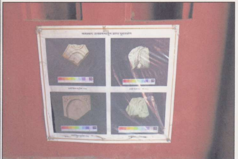
Remains found during Excavations at Nagardhan