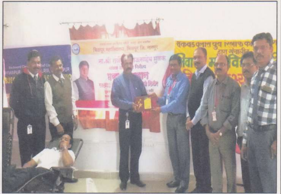
The Principal of the College was felicitated by Jeevan Jyoti Blood Bank for organizing this Mega Blood Donation Camp