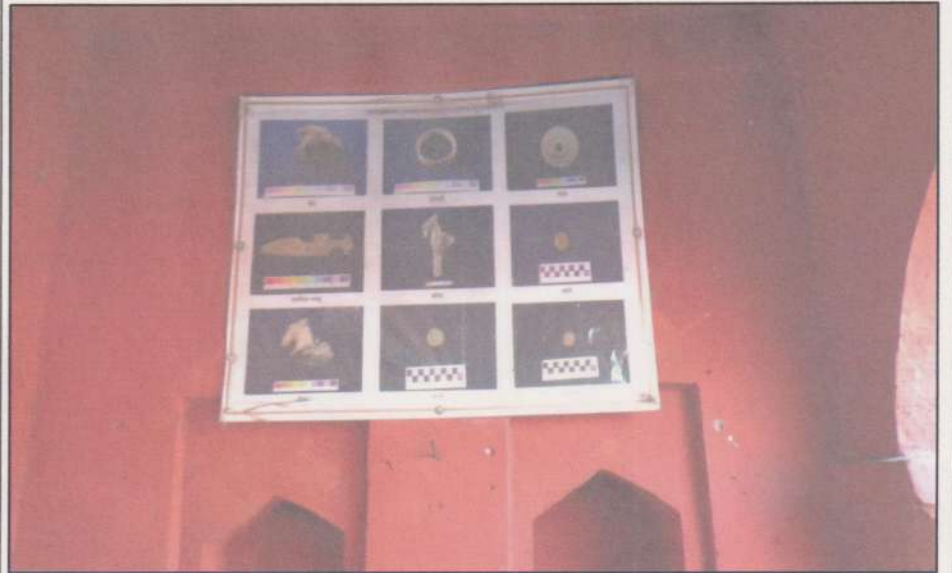
Remains found during Excavations at Nagardhan